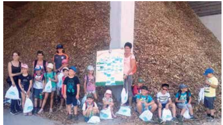
Die Kinder lernen in den Ferien spielerisch neues kennen.

Auch Richtung Bogenneusiedl wurden die fehlenden Kanalstränge aufgenommen. Damit ist nun das gesamte Kanalnetz von Kreuzstetten digital erfasst. Wichtig auch bei Grabungsarbeiten, um nicht versehentlich irgendwo hineinzu baggern.