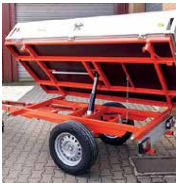
Der Kipper wird schon dringend benötigt (Symbolbild).

Zuständig: GfGR Roland Kreiter, Gemeinderat