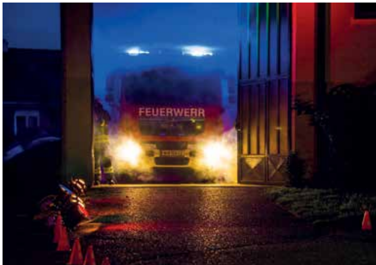
HLF1-W wurde mit Lichtershow vorgestellt.