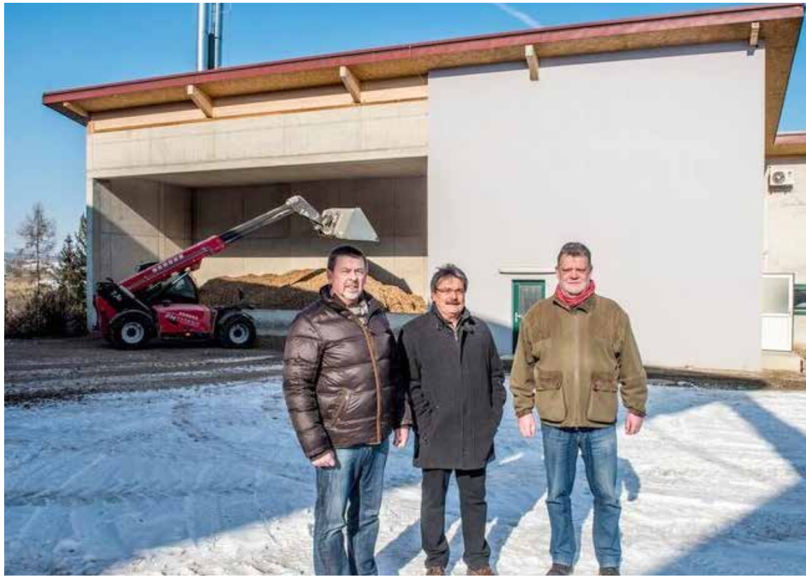
Das Nahwärme-Problem konnte mit vereinten Kräften doch noch gelöst werden.