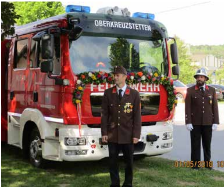
Segnung des neuen Feuerwehrautos.