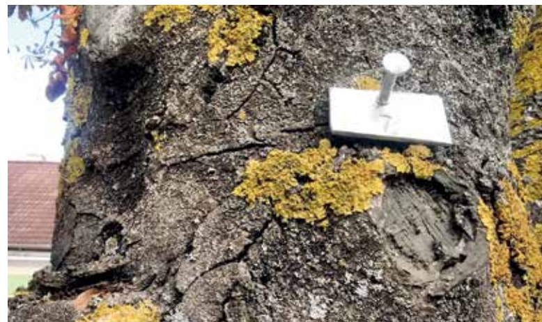
Kritische Bäume stehen unter strenger Beobachtung.