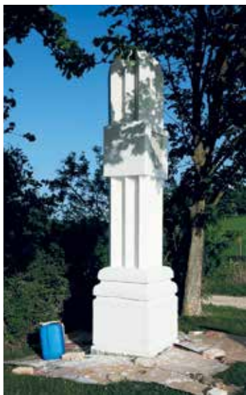
Das Kommasierungsmarterl wurde ebenfalls vorbildlich hergerichtet.

Der nächste Umgang im Mai 2019 führt zu diesem Marterl.