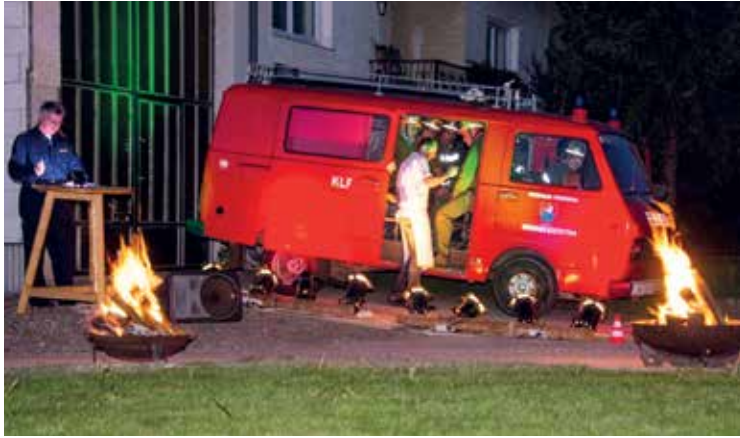
Außerdienststellung des Kleinlöschwagens.

Verantwortlichen der Landesregierung im Namen der Bevölkerung und der FF Oberkreuzstetten.