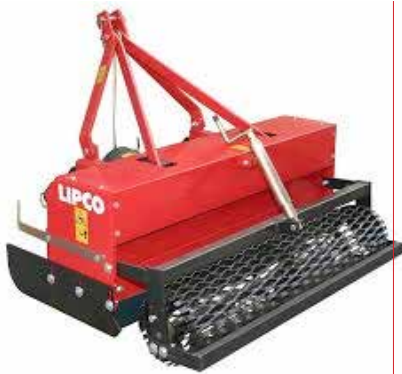
Fräse zur leichteren Unkrautbeseitigung auf den Friedhofswegen.