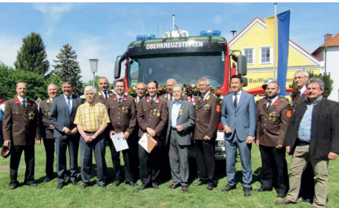
Feierstunde bei der FF Oberkreuzstetten.

Die Gemeinde hat die Kosten zu ca. 50 % übernommen. Der Preis lag bei knapp 200.000 Euro. Der Ankauf des