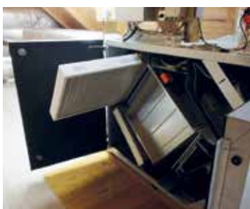
Die Lüftungsanlage im Gemeindezentrum

Zuständig: FC-Kreuzstetten, Bgm., Gemeindearbeiter