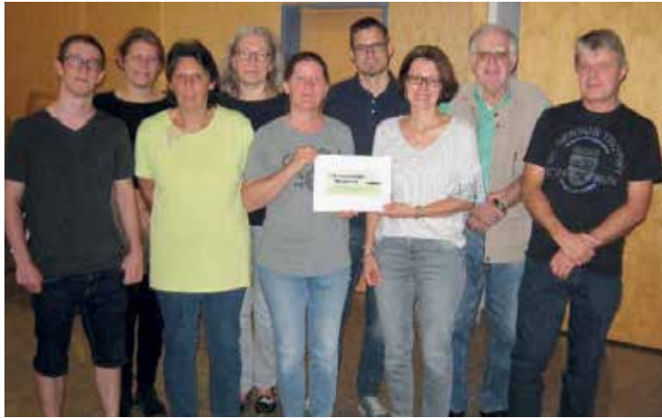
Ein herzliches Dankeschön an alle beteiligten Gemeindebürger.

Von vielen mit Skepsis aufgenommen, gab es von mir für den Bürgerrat ein sofortiges „Ja!“ Für mich als Bürgermeister ist das DIE Möglich-