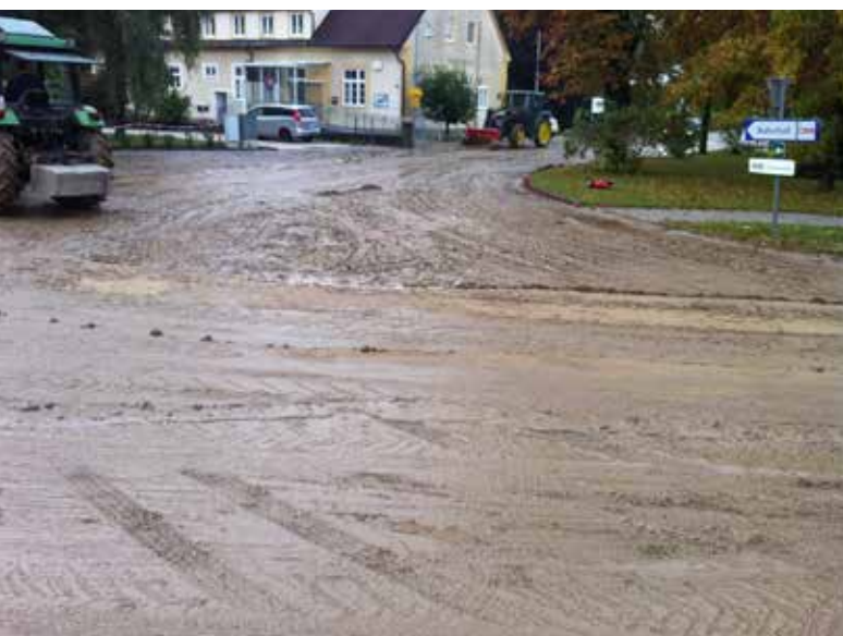
Großeinsatz für die FF Kreuzstetten.