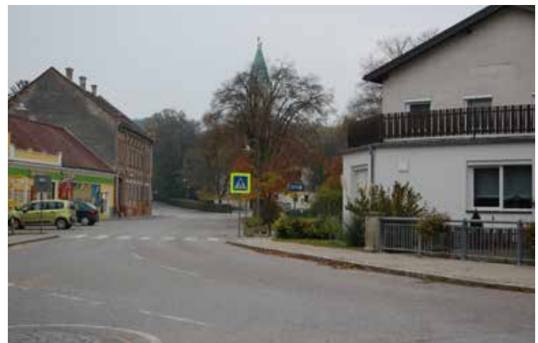
Vorrangiges Ziel ist es, auf der Landesstraße eine Verkehrsberuhigung herbeizuführen, denn so wie auf dem Bild, sieht es hier leider nur selten aus.

Wir sind uns sicher, dass der „2. Kreuzstettener Bürgerrat“ wieder interessante Vorschläge erarbeitet.