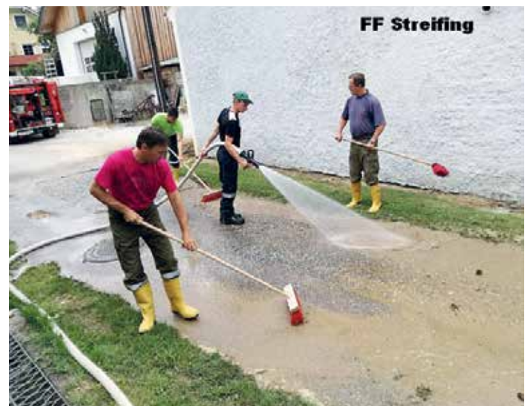
Unwetter in Streifing.