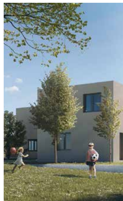
Die Wohnanlage wird viel Frei