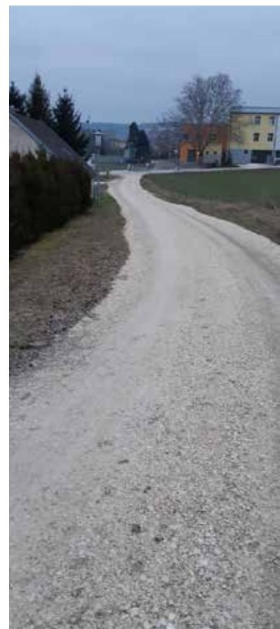
Nur regelmäßigs Ausbessern der Güterwege kann deren Wert erhalten.