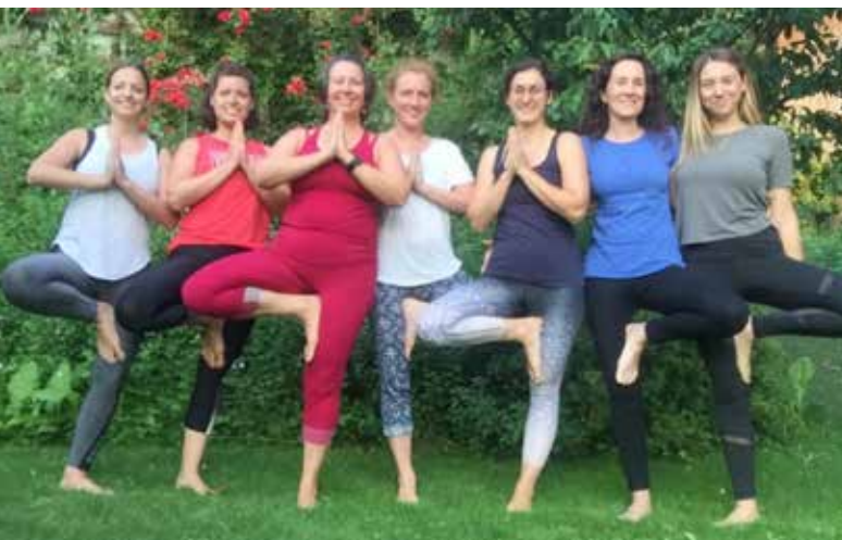
Joga zum Ausgleich und zum Finden der inneren Balance.

Fahrverbot Da es durch die alten Bäume und in die Straße ragenden niedrigen Dacheindeckungen der Presshäuser in der Lindengasse des Öfteren zu Schäden kam, wurde ein Fahrverbot verhängt. Außerdem ist es durch die Enge der Straße immer wieder zu brenzligen Situationen gekommen. Daher wurde in Zusammenarbeit mit der zuständigen Behörde ein „Fahrverbot ausgenommen Anrainerverkehr“ erlassen. Zuständig: Gemeinderat