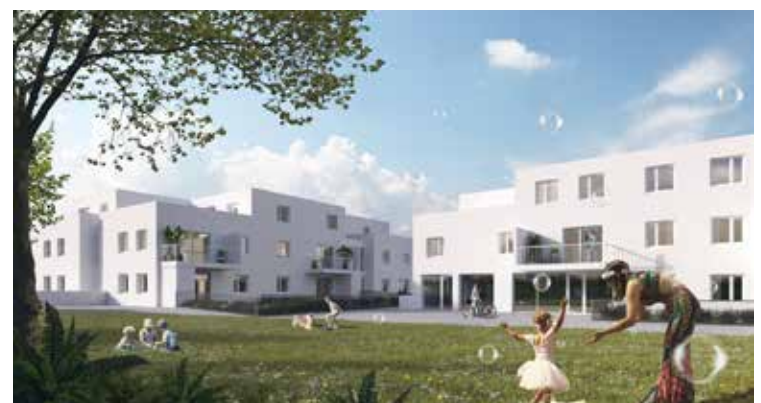
Viel Grün wird die neuen Wohnbauten umgeben.