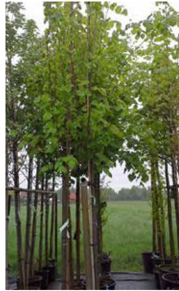
Vom Topf in die Umwelt.

Der Plan mit den vorgesehenen Pflanzstellen muss natürlich von der Gemeinde auch dahingehend überprüft