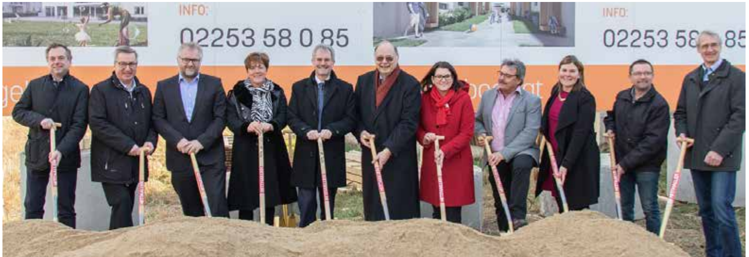
Beim Spatenstich war viel Prominenz aus Nah und Fern in unsere Gemeinde gekommen.