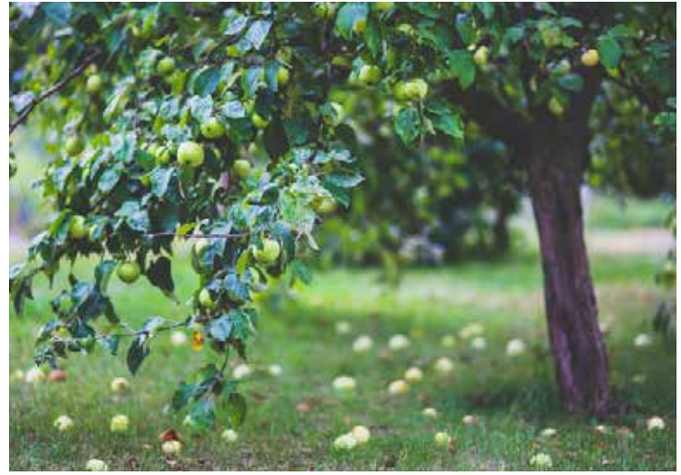
Obstbäume gehören zum Landschaftsbild des Weinviertels.

Damit ist der Bestand des Obsthaines gesichert, eine gute Sache von unseren jungen Mitbürgern in Oberkruzstetten für Kreuzstetten – ein herzlicher Dank an alle Beteiligten!