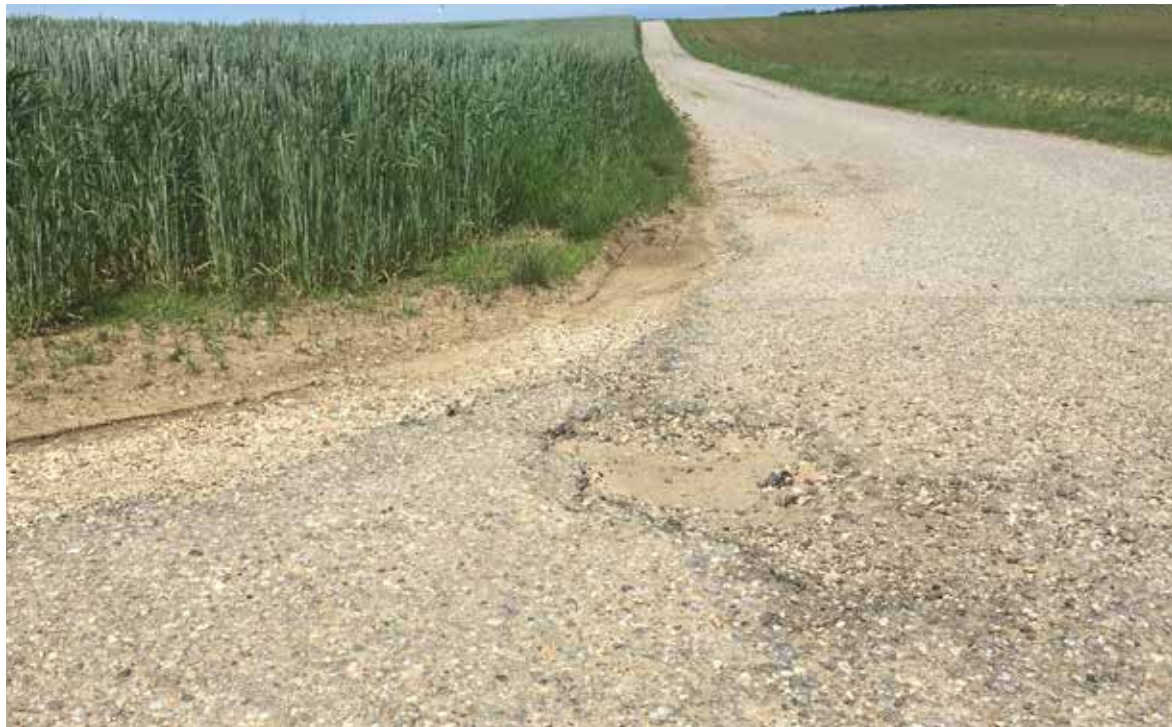
Durch Überschreiten der Belastungsgrenze entstanden erhebliche Schäden.

Das Aufbringen einer Spritzdecke im Bereich von Oberflächenrissen der asphaltierten Güterwege war Witterungsbedingt nicht mehr möglich. Die Gesamtkosten