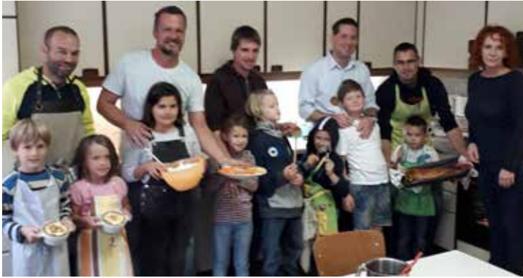
Foto links: Beim Vater-Kinder-Kochkurs fanden sich die wahren Profis in der Küche. Auf dem rechten Foto einige Teilnehmer der Wirbelsäulen-Gymnastik - gerade für Menschen mit sitzenden Jobs ein guter Ausgleich.