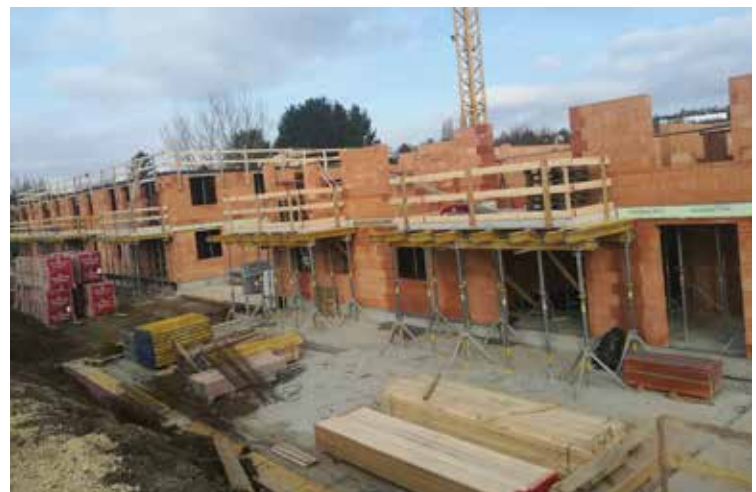
Der Wohnbau in Streifing liegt im Zeitplan.

Inzwischen, nach diversen Freigaben des Landes sollten auch auf der Gemeinde Anmeldeformulare aufliegen. Wie man sieht, ist die Nachfrage nach förderbaren Wohnungen sehr groß – wenn das Angebot stimmt.