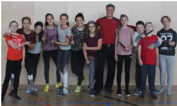
Gerade für junge Menschen ist es wichtig, sich auch selbst verteidigen zu können. Mit diesen Kids sollte man sich nicht anlegen!