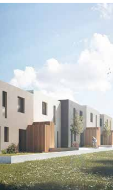
raum für die Kinder bieten.

Bei Musik und einer kleinen Stärkung fand die Spatenstichfeier in Streifing ihren Ausklang. Ich danke dem Musikverein und der FF-Streifing auf diesem Wege nochmals für die Unterstützung bzw. Bewirtung bei der Spatenstichfeier herzlichst.