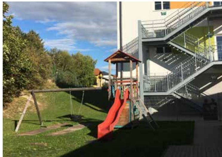
Die Spielgeräte haben eine Schutzhütte bekommen.