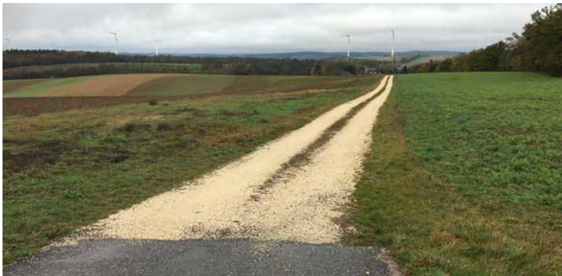
Nach Fertigstellung der Windräder kann auf Gradermaterial zugegriffen werden.