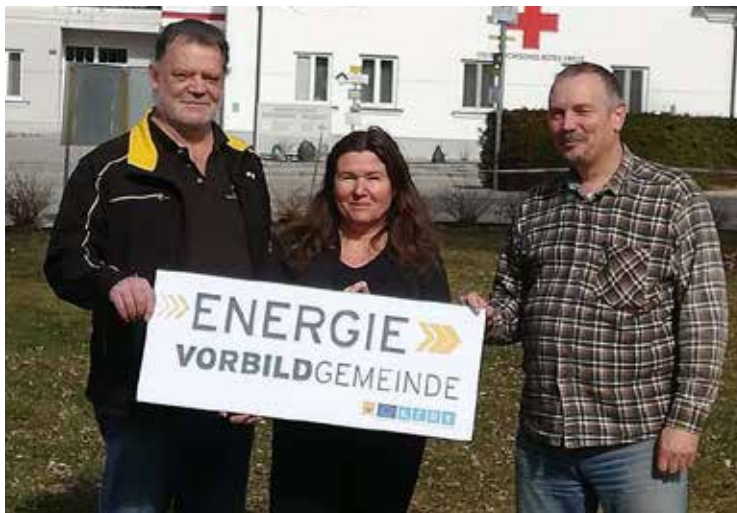
Wir wurden als Energie-Vorbildgemeinde ausgezeichnet.

Seit 2013 sind Gemeinden per NÖ Energieeffizienzgesetz verpflichtet, ihre Energieverbräuche durch eine Energiebuchhaltung zu überwachen.