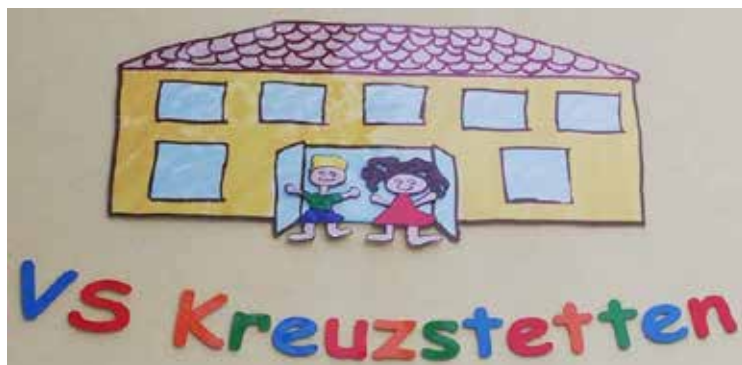
Die neu sanierte Schule hat auch ein neues Logo bekommen.

Normen, Risiken wurden beantwortet. Alle Experten haben festgestellt, dass unsere Schule lichttechnisch gut gestaltet ist und das Licht nicht schädlich ist (Risikoklasse = 0). Die Lampen fallen in der